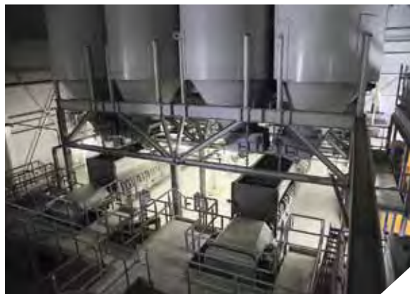
Бетономесительный центр предприятия производства компании Skako

Весной прошлого года стартовал проект компании «Ирдон» по основанию нового домостроительного предприятия в Октябрьском районе Ростовской области. Компания «Ирдон» входит в холдинг «Евродон», хорошо известный как лидер российского рынка по производству и переработке мяса индейки. Главная задача, поставленная перед новым ДСП, – это обеспечение жильем сотрудников постоянно растущего агропромышленного комплекса холдинга. Проект нового ДСП был разработан немецкой компанией Avermann, которая также выступила генеральным подрядчиком в процессе поставки и запуска оборудования. В качестве партнеров для реализации проекта компания Avermann привлекала фирмы Skako и Progress. Спустя год после начала строительства ДСП корреспондент журнала «ЖБИ и конструкции» побывал на уникальном предприятии в Шахтах.