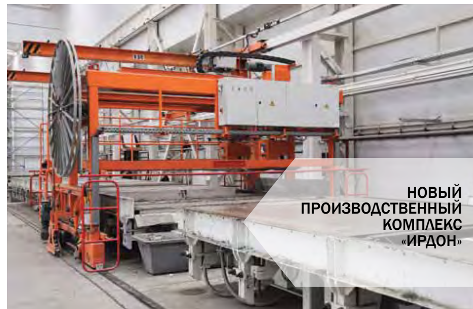
Для заглаживания верхней поверхности изделий машина снабжена дисками и лопастями