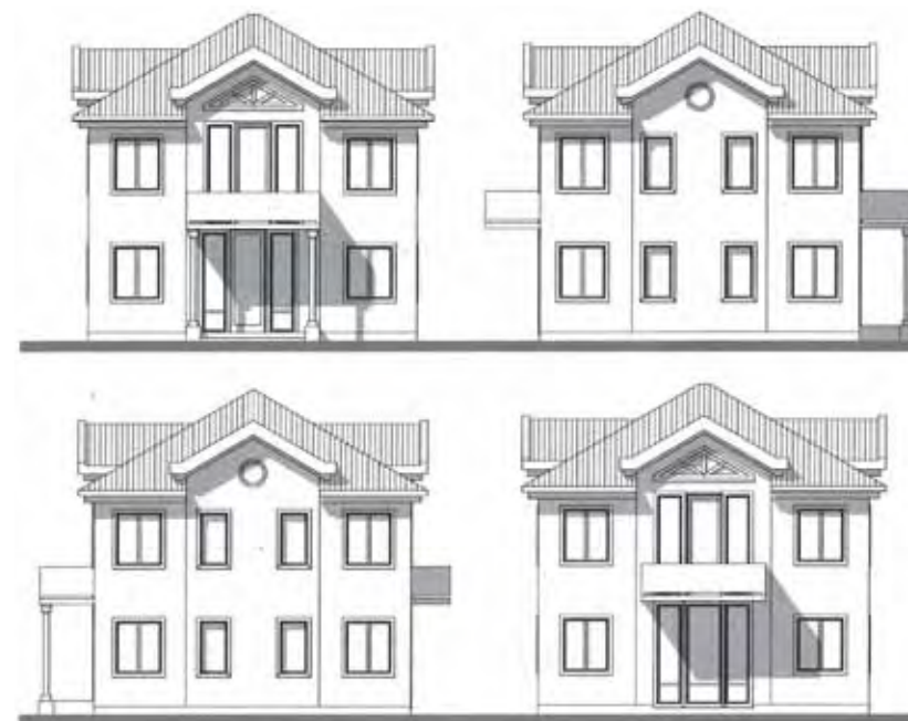
Общая площадь здания – 138,3 кв. м