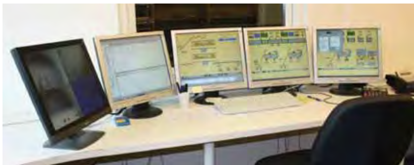
Центр управления работой БСУ