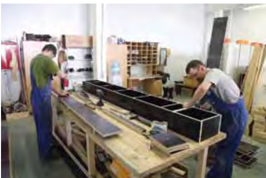
Участок изготовления опалубки

Для каждого стола возможен индивидуальный нагрев, что позволяет достичь экономичной и эффективной сушки отформованного изделия