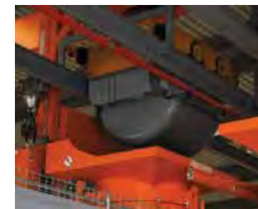
Ковшовая вагонетка над бетонораспределителем