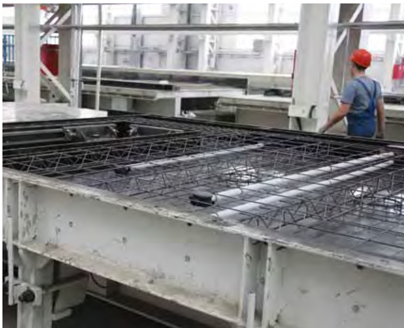
При изготовлении на наклонных столах трехслойных панелей сначала формируется опалубка, затем укладывается арматура

Для каждого стола возможен индивидуальный нагрев, что позволяет достичь экономичной и эффективной сушки отформованного изделия