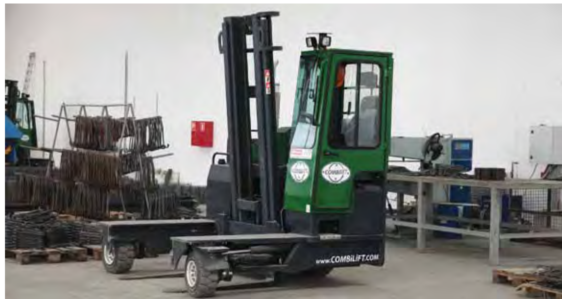
Машина для транспортировки сетки по цеху, способная двигаться в любых направлениях