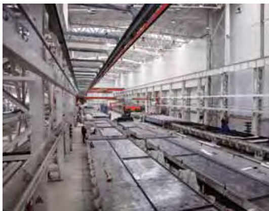
Производственная линия по изготовлению готовых бетонных элементов на стационарных наклоняемых столах производства компании Avermann