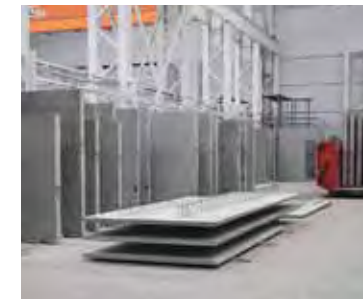
Участок доводки изделий