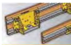
Системы опалубки PSV