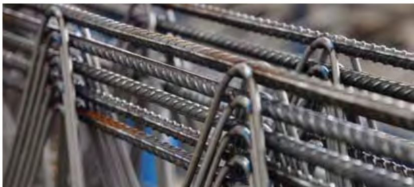
Сварочный автомат может сваривать друг с другом арматуру различного диаметра в любом сочетании