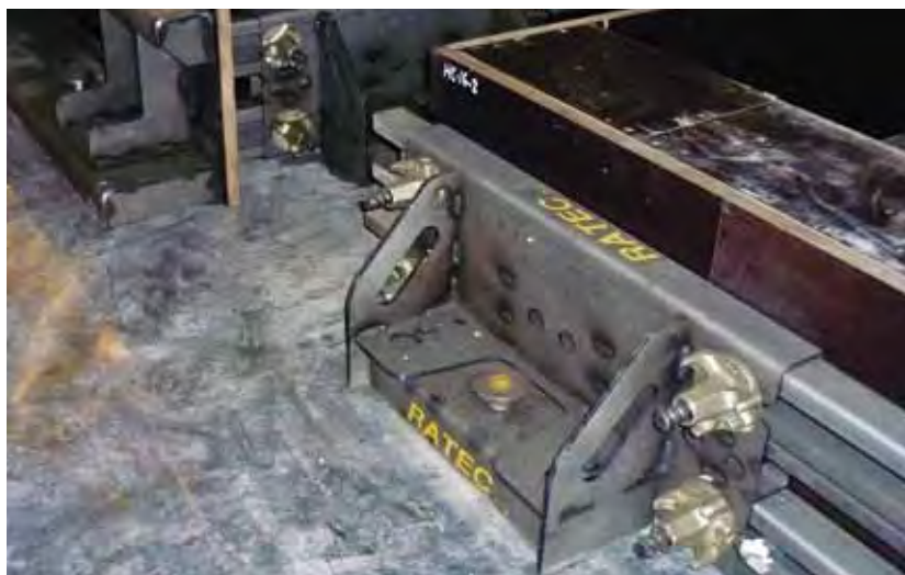
Линия Avermann оснащена бортоснастной кампанией RATEC, хорошо знакомой российским заводам своим качеством и инновативностью

Благодаря используемой системе контурной опалубки и магнитам производства RATEC возможно устанавливать опалубку для изделий с довольно высокой мобильностью и вариативностью по форме. Система опалубки представлена в двух вариантах: MHS и PSV. MHS – это система деревянной опалубки со встроенными мощными магнитами, обладающая простотой позициониро-