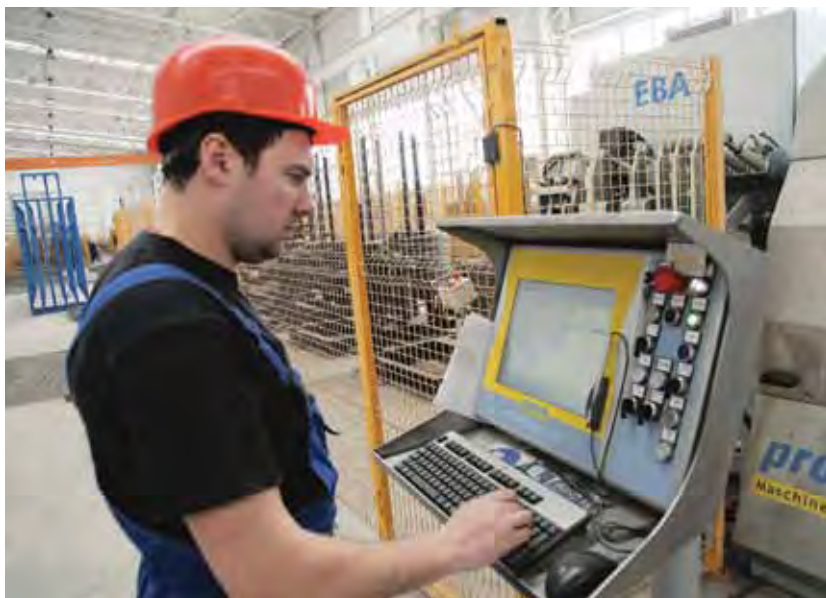
Оператор задает на дисплее гибочного автомата EBA S-12 AR форму скобы