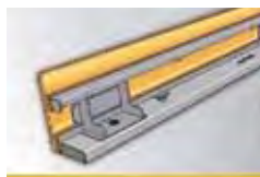
Системы опалубки MHS