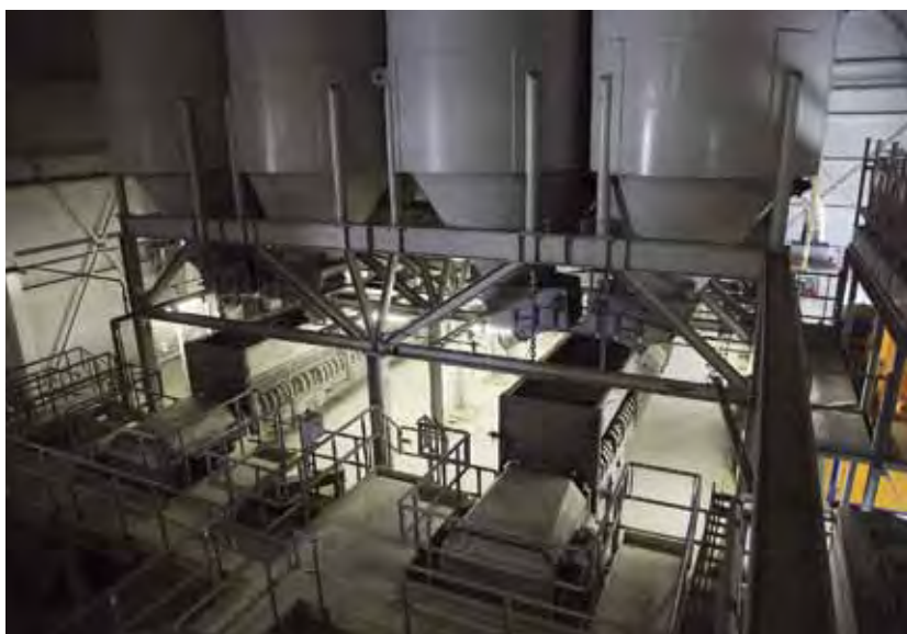
Силосы для хранения инертных с системой дозирования

« ПРИ ТАКОМ ОСНАЩЕНИИ БСУ Я МОГУ ПОЛУЧАТЬ ОЧЕНЬ РАЗНООБРАЗНЫЙ, КАЧЕСТВЕННЫЙ И СОВРЕМЕННЫЙ БЕТОН. ДЛЯ ОДНОГО ЗАМЕСА Я МОГУ ИСПОЛЬЗОВАТЬ 2-3 РАЗЛИЧНЫЕ ДОБАВКИ »