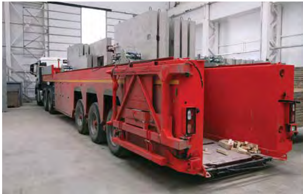
Специальный трехосевой полуприцеп для транспортировки готовых изделий

С помощью гибочного автомата EBAs S-12 AR изготавливаются скобы диаметром от 5 до 12 мм, формы для которых задаются оператором на дисплее.