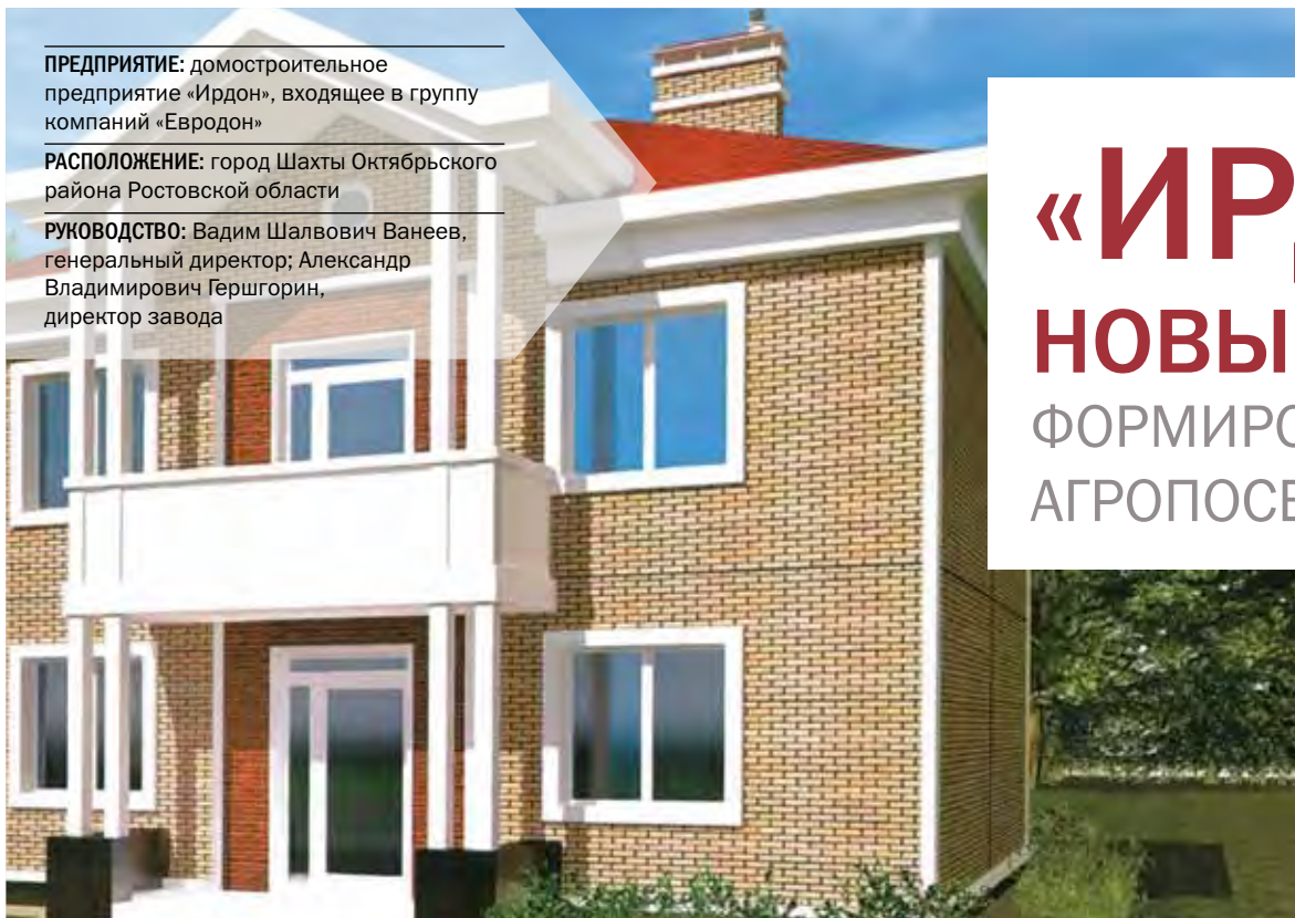
Типовой домостроительный проект индивидуального жилого дома