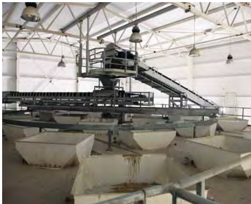
Установка для распределения заполнителя в силоса-накопители

Подача инертных материалов осуществляется по системе конвейеров, которая состоит из двух конвейерных линий. Один и тот же замес может происходить с участием обеих линий. Конвейерные линии конструкционно имеют возможность работать в обратном направлении – так называемая «обратка», которая используется при чистке силосов, если в силосах накопилась грязь. Инертные материалы подаются автотранспортом и затем по конвейеру поднимаются наверх, где по принципу карусели, по кругу, при помощи поворотно-реверсивного ленточного конвейера подаются в один из силосов. БСУ имеет вывод под товарный бетон.