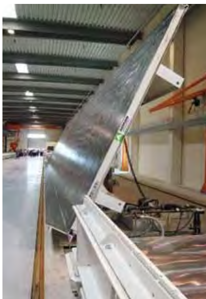
Производственная линия формования сконструирована с применением стационарных наклоняемых столов