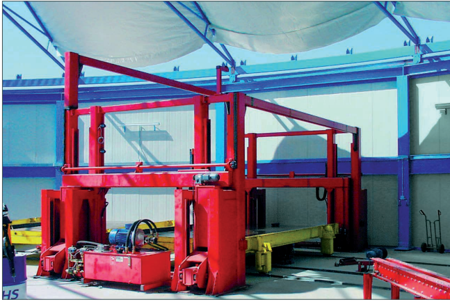
Stacja podnoszenia i stacja rozkładania palet