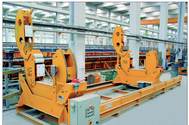
Urządzenie do obracania do wykonywania poprawek

Maszyny specjalne konstruowane są i produkowane indywidualnie z uwzględnieniem Państwa wymagań. Do dyspozycji Państwa jest nasz team ekspertów do rozwiązywania różnorodnych problemów.