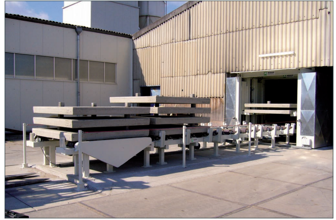
Urządzenie do podnoszenia płyt z betonu