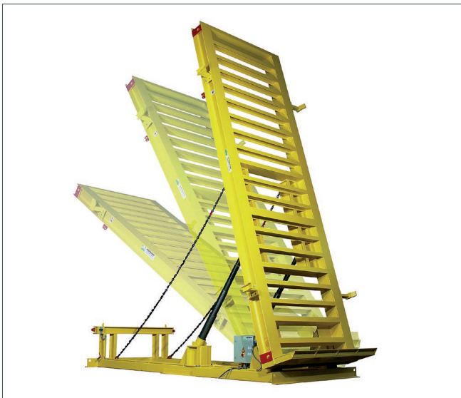
Przenośne stanowisko podnoszenia ścian