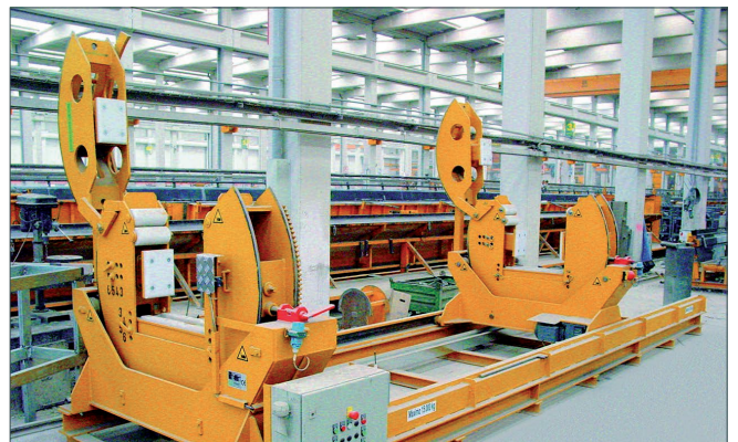
用于后期修整的预制柱旋转设备

特殊设备可根据客户的需求进行研发和生产。我们的专家团队为您提供多样化的需求提供完美解决方案。