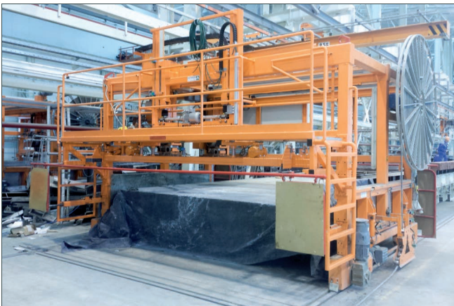
Flügelglätter und Abziehvorrichtung