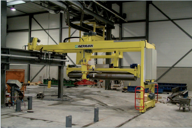
Flügelglätter und Rüttel-/Glättwalze