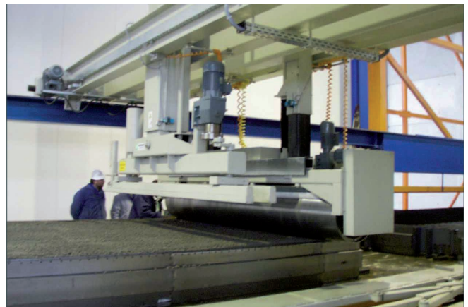
Abziehvorrichtung und Rüttel-/Glättwalze