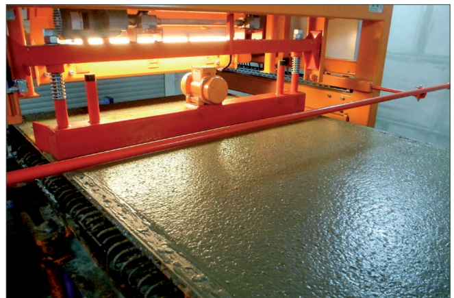
Abzieh-Rüttelbohle am Betonverteiler

Avermann Betonfertigteiletechnik GmbH & Co. KG